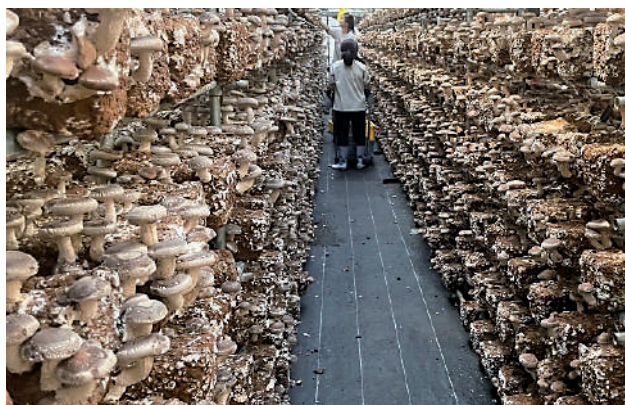
901号空調全面初回発生