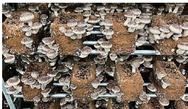
リンネ農園様 902号発生例