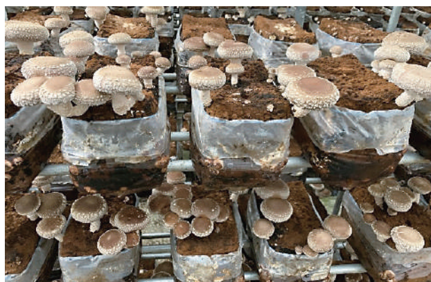
705号自然上面10月発生