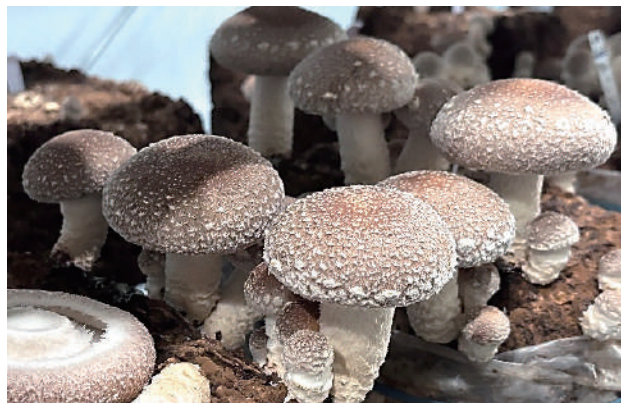
上面栽培向け開発品種