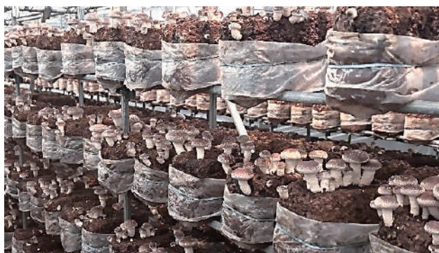
有限会社雅様 705号発生例