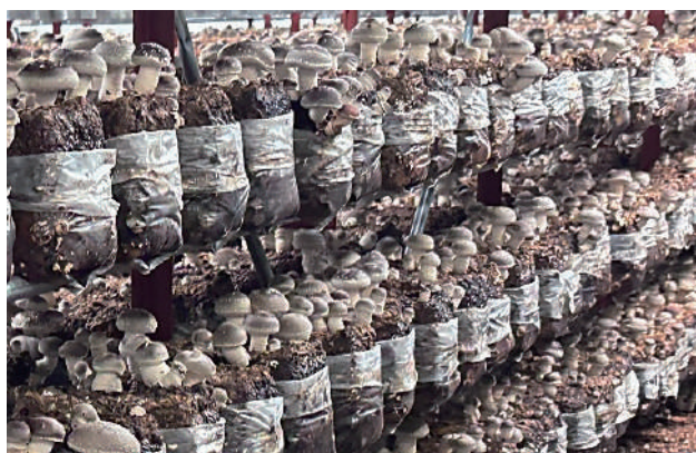
905号空調上面2回発生

サンマッシュ既存品種（607号、705号）およびここ10年程で発売した新世代品種（715号、901号、902号、905号など）について、品種の特長を生かした実際の栽培事例を紹介します。特に、栽培のコスト削減につながる『省エネ化』や『省力化』、販売力の強化につながる『安定生産』や『販促の取り組み』などに焦点をあてながら解説します。