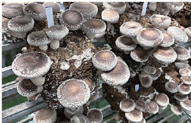
もぎとり易い全面栽培向け開発品種

加えて、『きのこがもぎとり易く、収穫作業の省力化』につながる空調全面栽培用品種、および『夏場の省エネ的な温度管理に対応』する上面栽培用品種について、開発状況や品種の特長を示します。またこれらの品種は、翌日の視察先において発生展示を行ないます。