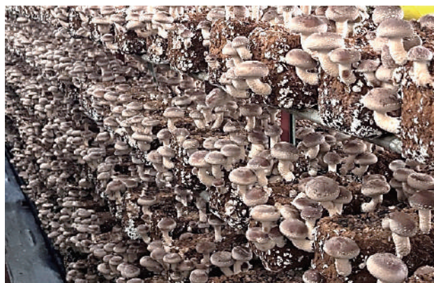
902号空調全面初回発生