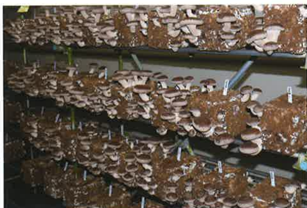
北研 901 号

2019年の全国大会で発表し、同年2月より試験販売中の新品種「北研 901 号」「北研 902 号」は、全国各地で試験導入が進んでいます。今回は、この二品種の基本栽培特性の確認と、それぞれの特長を活かした具体的な使い方について栽培事例を取り上げながら提案します。