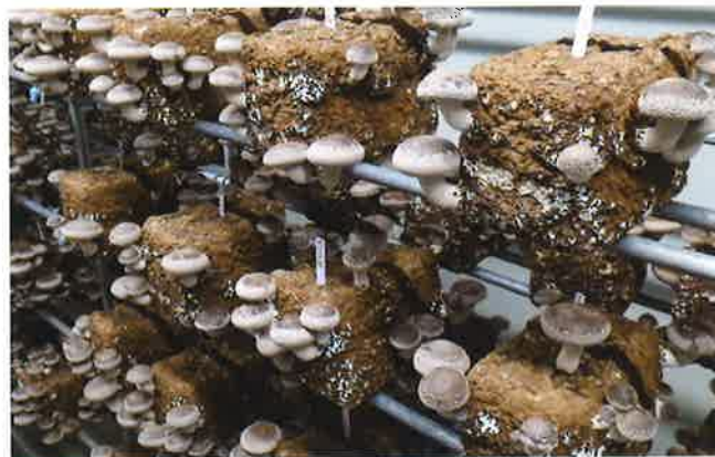
北研 902 号